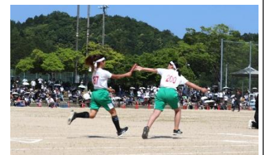
市小学生陸上競技大会の様子

5月16日に開催されました「第50回舞鶴市小学生陸上競技大会」に向けて、出場する6年生、そして自主的に練習に参加した5年生が、自分の目標を掲げ、放課後の時間を使って一生懸命練習を積み重ねてきました。当日には、出場を決めた舞鶴市内の6年生が一堂に会し、技を競い、練習してきた成果を精一杯発揮しました。志楽小学校の子どもたちも練習を通して仲間とともに切磋琢磨し、大会当日にはそれぞれに記録を伸ばすなど大健闘し、心身ともに大きく成長を遂げました。自信を付けた人、悔しい思いをした人などそれぞれの思いがあったことと思いますが、大会を通して得たものを今後の生活でも発揮し、努力を積み重ねてきたひたむきな姿勢を周りの友達にも広げてほしいと願っています。